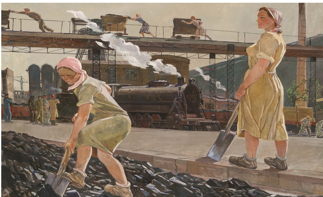
Дейнека А.А. «Донбасс» (1947)